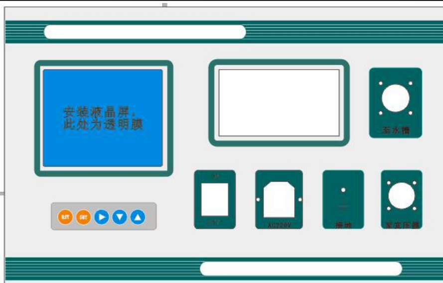
图1 绝缘手套（靴）操作箱