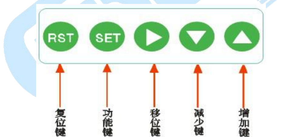
图 3 操作键面板